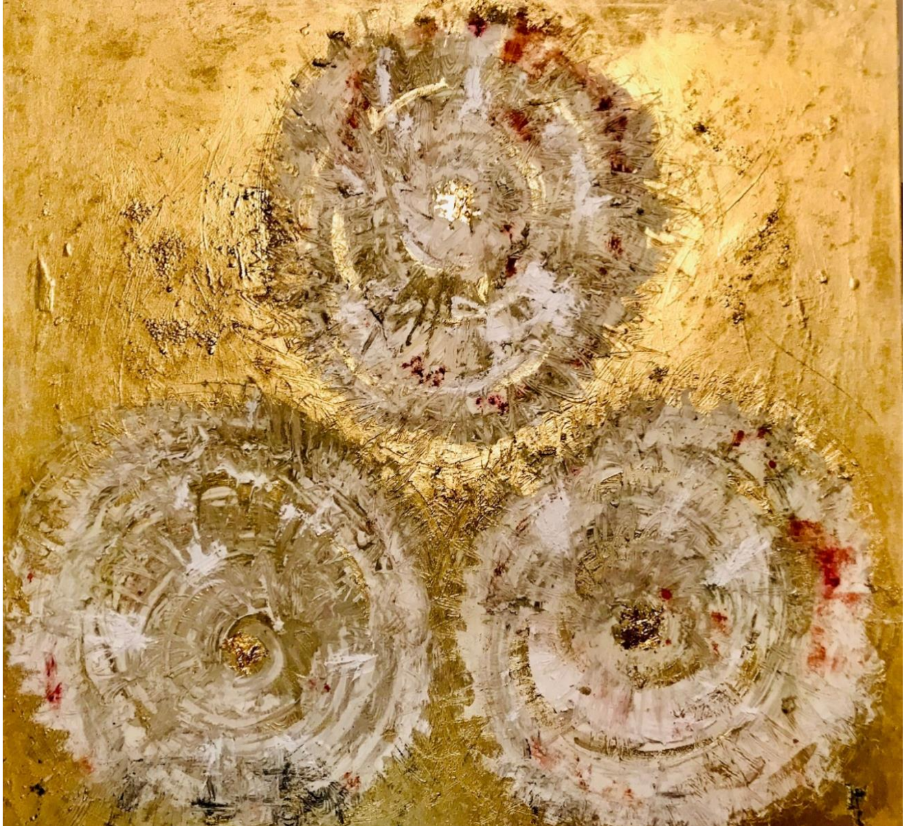
Ostersonntag – Auferstehung , Naturpigmente, Edelmetalle auf Leinwand, 90 x 90 cm

Easter Sunday - Resurrection, natural pigments, precious metals on canvas, 90 x 90 cm