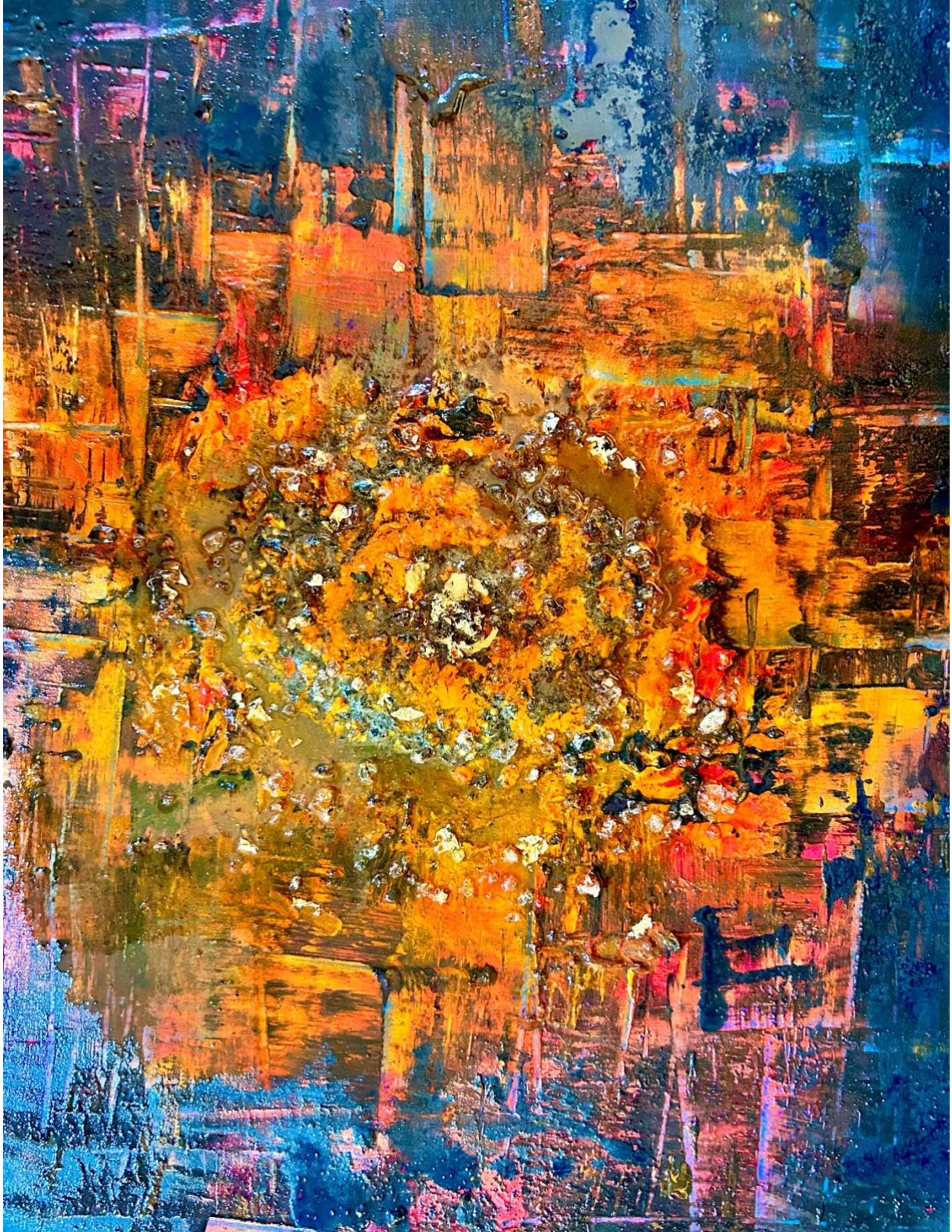
Licht und Schatten – Station VI Veronika reicht Jesus das Schweiß Tuch, Naturpigmente, Edelmetalle, Galbanum Harzöl auf Leinwand, 2023, 80 x 80 cm