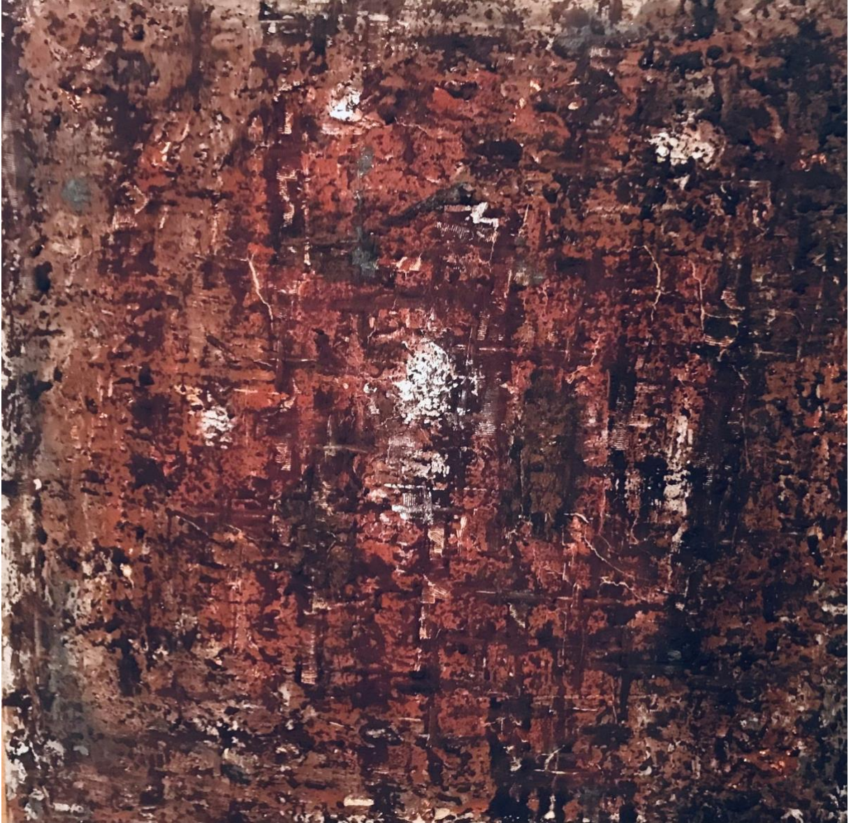
Karsamstag – Stille / Garten , Naturpigmente, Edelmetalle auf Leinwand, 90 x 90 cm

Holy Saturday – silence / garden, natural pigments, precious metals on lei